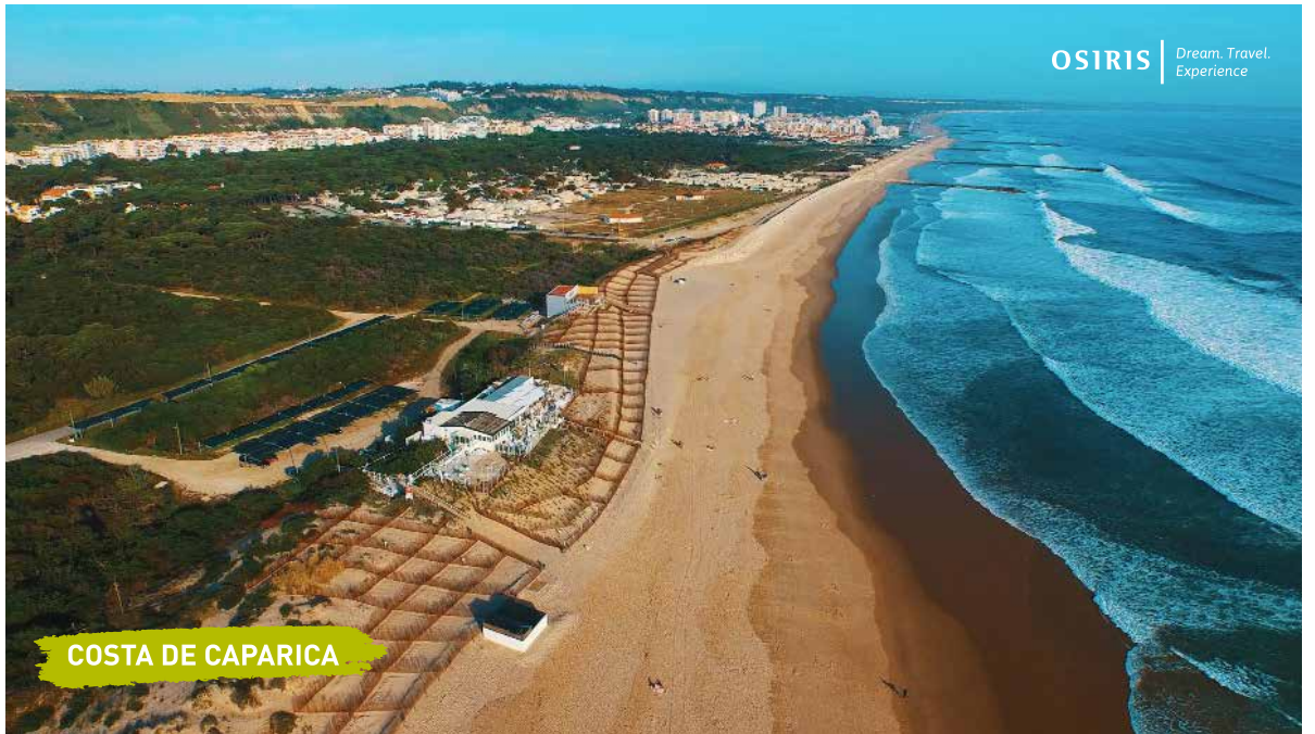
COSTA DE CAPARICA